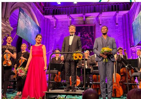
Concert d'Ouverture 2024, Opus 43