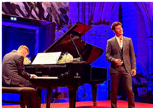
Récital à l'Eglise d'Auvers-sur-Oise, 2022