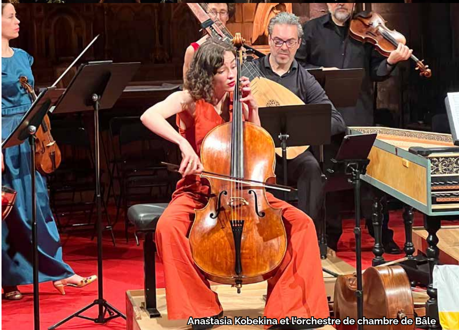
Anastasia Kobekina et l'orchestre de chambre de Bâle