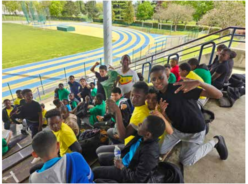
Les enfants posent avec la Flamme !