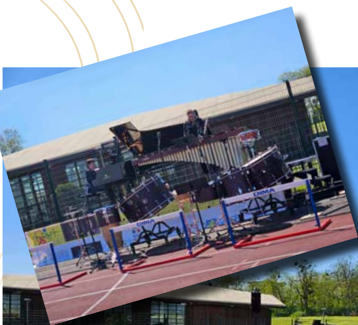
Place à la musique ! en plein air dans le stade