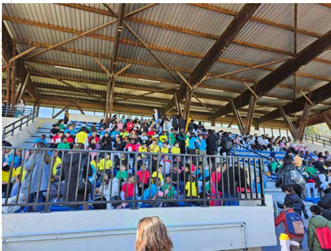
Arrivée au stade le jour J