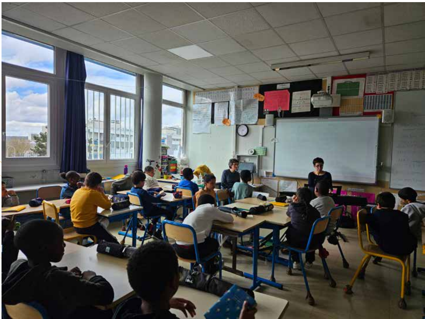
Sensibilisation participative sur les émotions ressenties à l'écoute des études de Chopin