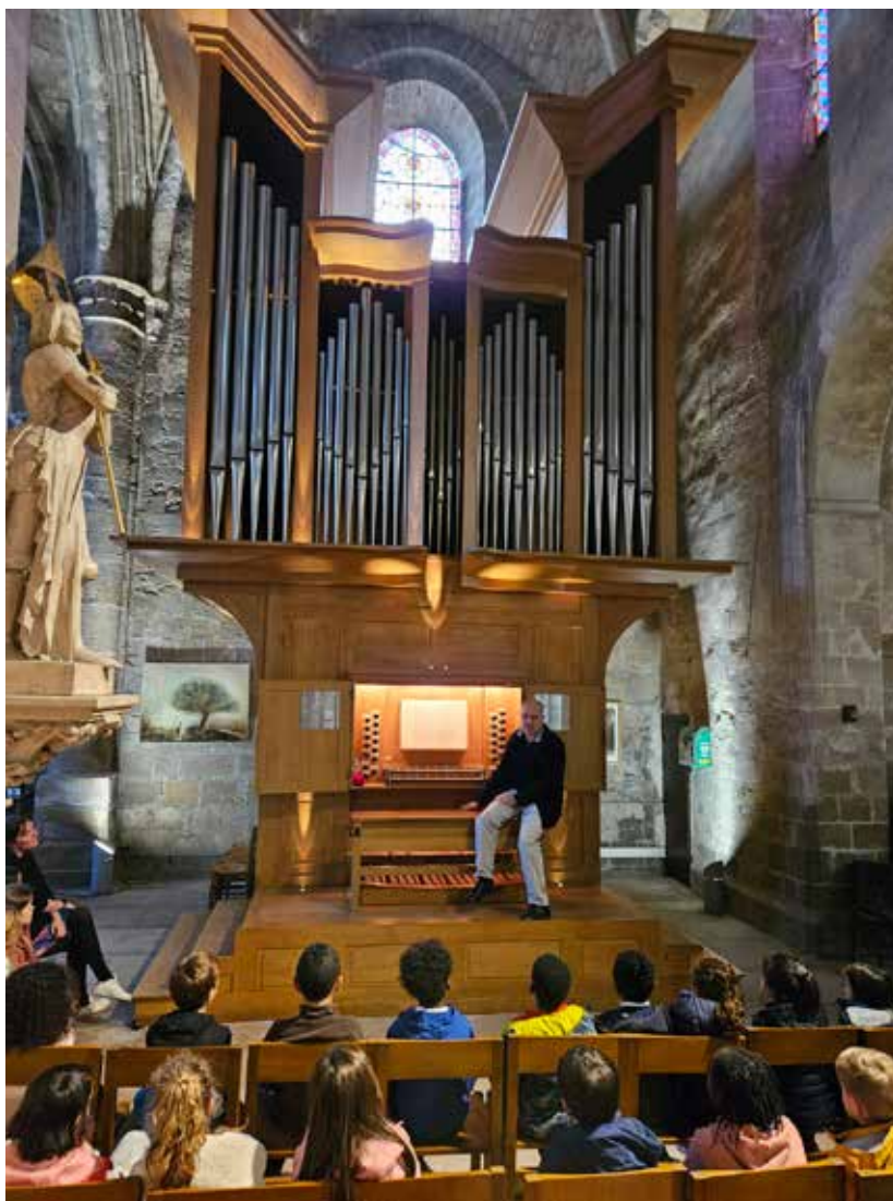
L'Orgue Aux Enfants

15 cours d'orgue + 10 répétitions et 2 sensibilisations