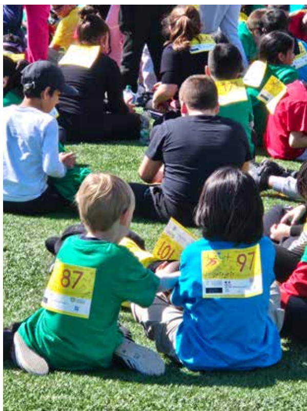
Les enfants s'installent pour le concert. Ils repartiront avec le dossard souvenir de l'évènement et le T-shirt aux couleurs olympiques.