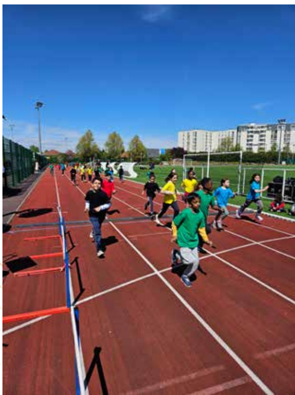
C'est parti pour le relais !