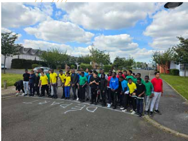
3,2,1 Partez !