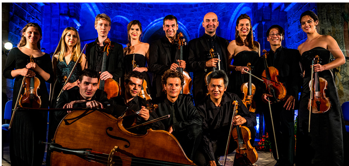
L'orchestre de chambre Nouvelle Europe, orchestre en résidence 2022 avec plusieurs concerts et sensibilisations