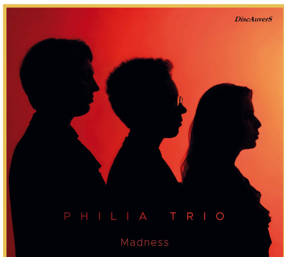
Le Philia Trio, dernier CD du label DiscAuvers

Pour 2022 le Festival signe le premier CD du Philia Trio, Trio original ( accordéon, violon, violoncelle) et au programme décoiffant avec notamment des créations contemporaines et des transcriptions. Depuis son lancement lors du concert de la Salle Cortot en Avril 2022, cet album reçoit un très bon accueil de la presse spécialisée. Il était déjà à l'origine labellisé "Choix de France Musique" mais a également depuis obtenu d'excellentes critiques dans Classica. Une réussite que le Festival compte poursuivre avec la présentation de l'album aux prochaines Victoires de la Musique classique.