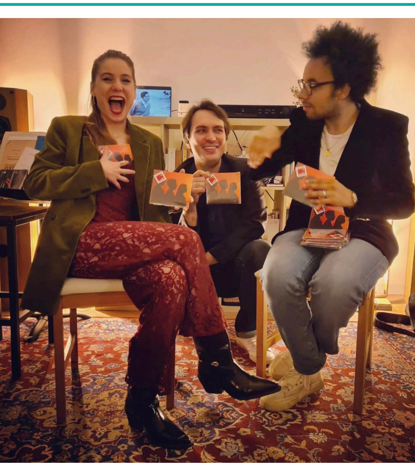
Le Philia Trio découvre le CD !!