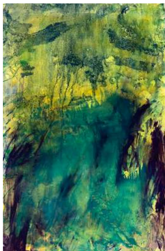
Anne Slacik, Printemps , 2021 peinture sur papier, huiles et pigments, 120x80 cm © Adagp, Paris, 2024