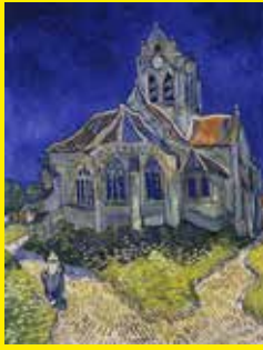
© V. Van Gogh - Eglise d'Auvers - Musée d'Orsay